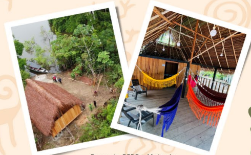
Proyecto REDD+ Matavén