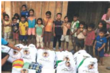
Entrega de toldillos y chinchorros