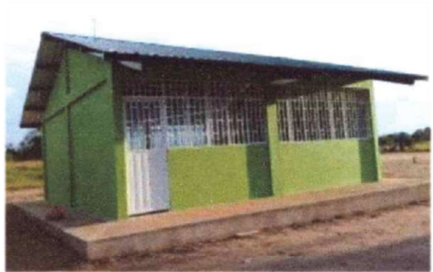
Aula construida en el centro educativo Boponé