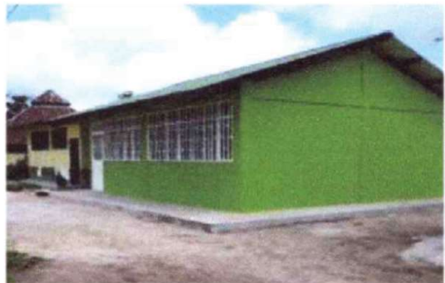
Aula construida en el centro educativo Sarrapia

En la una segunda fase construimos salones en las siguientes instituciones: