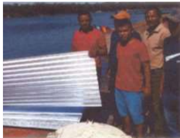
Material para el mejoramiento de los tejados de las viviendas